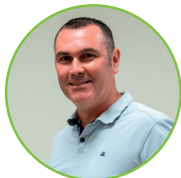
Ludovic CHAPUT Maire