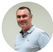
Ludovic CHAPUT Maire